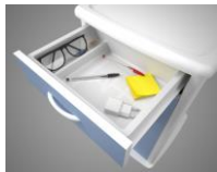
Version 1 porte